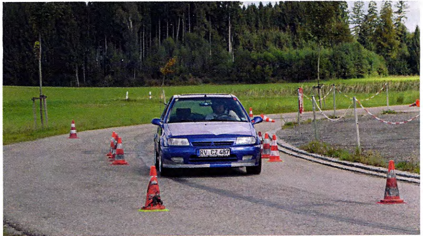
Fest Andreas/Sieger Klasse A1