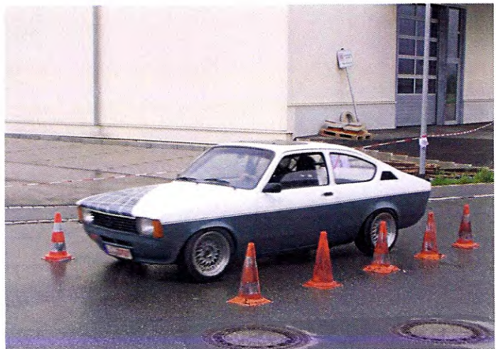
Hehl Fabian/Sieger Klasse A3